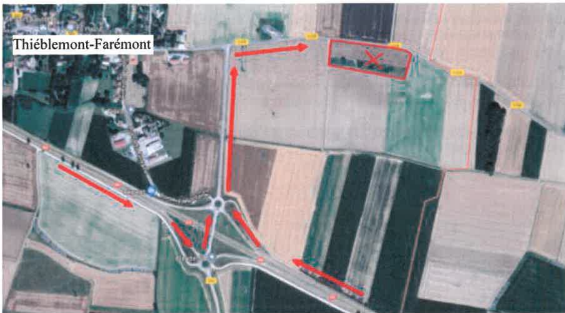
Emprise du projet

Le dossier indique que le terrain a déjà été viabilisé par la communauté de communes Perthois Bocage et Der (adduction d'eau potable, électricité, génie civil pour le téléphone et la fibre optique), sans indiquer si l'état initial a été réalisé avant la viabilisation. Si celle-ci a été réalisée expressément pour le futur crématorium, la viabilisation fait alors partie intégrante du projet 5 , ses incidences éventuelles doivent être analysées au travers de l'évaluation environnementale et l'état initial du site est l'état avant toutes opérations.